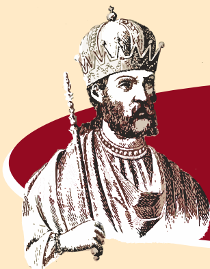
Αλέξιος Α΄ Κομνηνός αυτοκράτορας (1081 – 1118 )

Πρόνοια, προνοιάριοι, ανάκτηση εδαφών, αποκατάσταση βυζαντινής κυριαρχίας, μάχη Μυριοκέφαλου, εξισλαμισμός Μ. Ασίας.